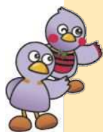
埼玉県マスコット 「コバトン」「さいたまっし」

悩んでいる人に気づき、声をかけられる人のことです。 特別な研修や資格は必要ありません。 誰でもゲートキーパーになることができます。 周りで悩んでいる人がいたら、 やさしく声をかけてみてください。 声をかけることで、 不安や悩みを和らげることに繋がります。